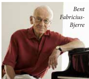
Bent Fabricius- Bjerre

gennem tiden leveret både døgnfluer og evergreens. Filmmusik, kendingsmelodier, sange, orkestermusik. Der er meget af hans musik, der er gået i glemmebogen. Men det lykkedes ham også af og til at skrive nogle melodier, vi ikke glemmer så let. Kendingsmelodien fra Matador er én af dem. Temaet fra Olsenbanden en anden. De to melodier kommer formentlig til at leve videre i vores fælles kulturelle hukommelse i mange år endnu.