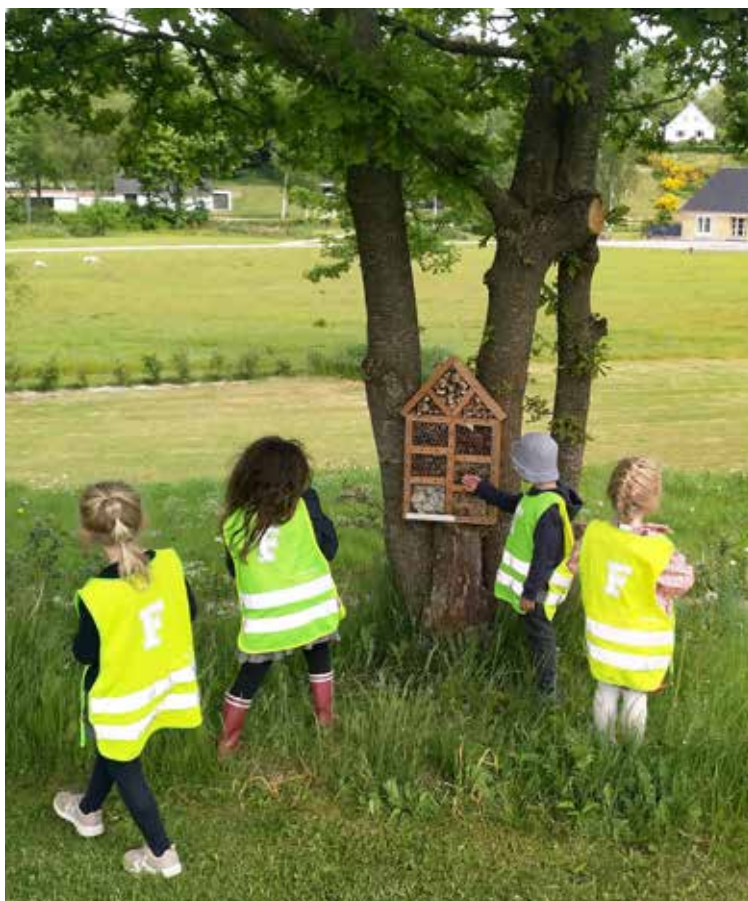
Børnene nyder synet af et af de ophængte insekthoteller, som de har lavet.