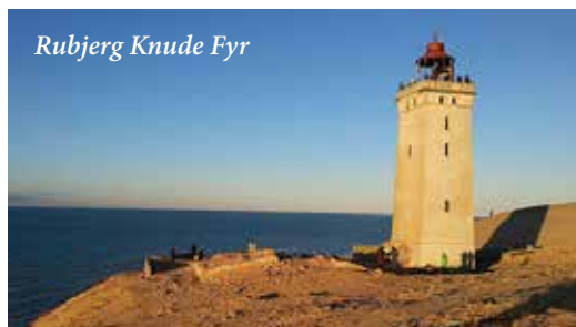
Rubjerg Knude Fyr

Tilmelding og betaling til Jette Søndergård, tlf. 29 76 075 2 senest den 26. oktober. Billetter sælges efter først til mølle princippet.