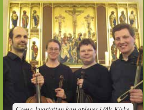
Coma-kvartetten kan opleves i Øls Kirke