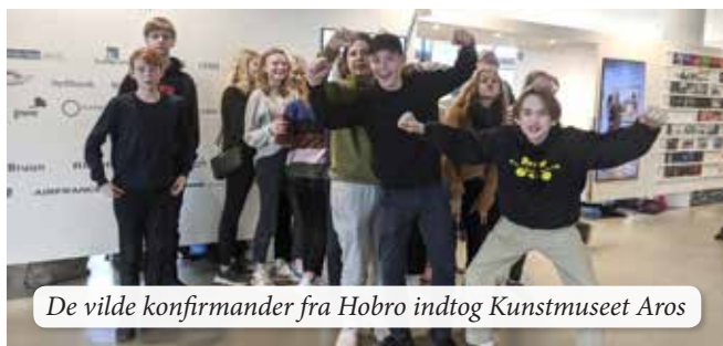
De vilde konfirmander fra Hobro indtog Kunstmuseet Aros