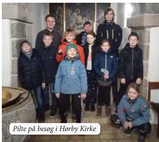
Pilte på besøg i Hørby Kirke

Piltene er i gang med at tage Kristendomsmærket,