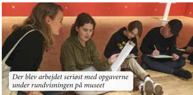
Der blev arbejdet seriøst med opgaverne under rundvisningen på museet

Man kan blive helt grøn af misundelse af at gå tur i Regnbuen på taget af Aros